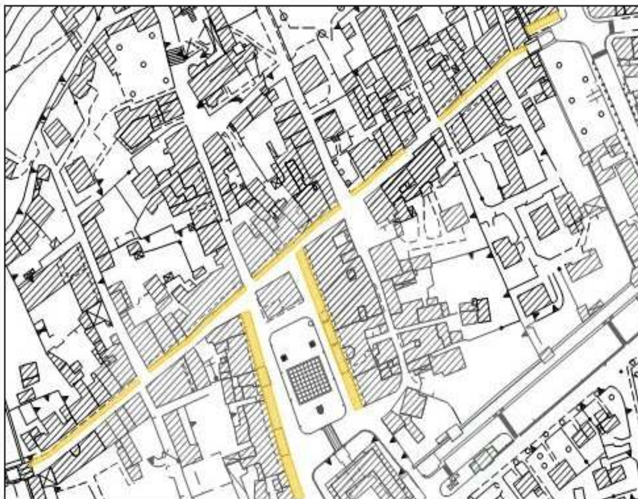
base CTR scala 1:2000